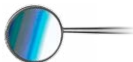
T051 Zrcátko #4 (7/8") T050 Zrcátko #5 (15/16")